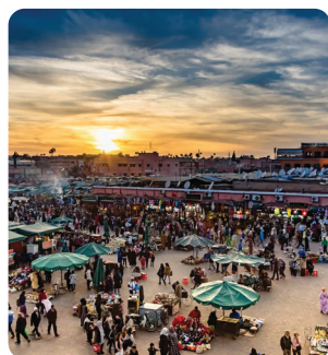
Jemaa el Fna

Capitale internationale du tourisme d'affaires, Marrakech accueille l'IMC 2025 au Pickalbatros Hôtel du Golf, Palmeraie. La ville offre une logistique éprouvée, une capacité hôtelière large et des services adaptés aux délégations.